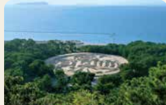
6 琴彈公園 巨大的錢形砂雕非常有名。