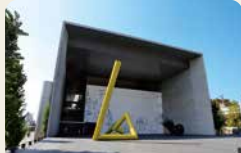
5 豬熊弦一郎現代美術館 豬熊先生是丸龜出身。館內還設有兒童造型教室。