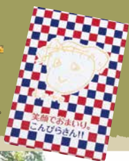
笑容煥發君朱印帳 印有金刀比羅宮的人偶。