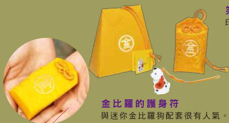
金比羅的護身符 與迷你金比羅狗配套很有人氣。