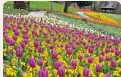
2 國營讚岐滿濃公園 可以享受各種體驗、體育活動的樂趣，還可在此露營休閒。