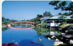
3 中津萬象園 日本庭園。兼設繪畫館及陶器館。