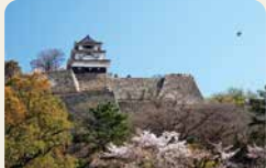
4 丸龜城 是一座擁有400年歷史的築城，其城牆是日本國內最高的石牆。