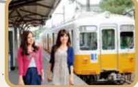
琴電琴平站 ☎0877-75-3068 前往金刀比羅宮參拜很方便。根據需要，有時會提供Retro(復古)觀光電車特別運行服務。