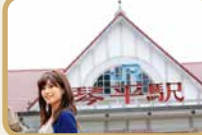
JR琴平站 ☎0877-73-4171 這裡是琴平觀光、參拜的起點。於1923年建成，是一個充滿歷史氣息的車站建築物。