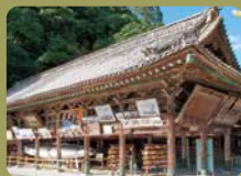
繪馬堂 堂內奉納著畫有船的繪馬（祈願用小木板），還有船員放入大海的「流樽」等各種繪馬。