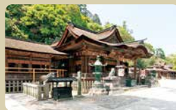
三穗津姬社 祭奠作為金刀比羅宮的主祭神的大物主神之後。