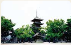
1 總本山善通寺 弘法大師的誕生地。屬於四國靈場八十八處寺廟之一。